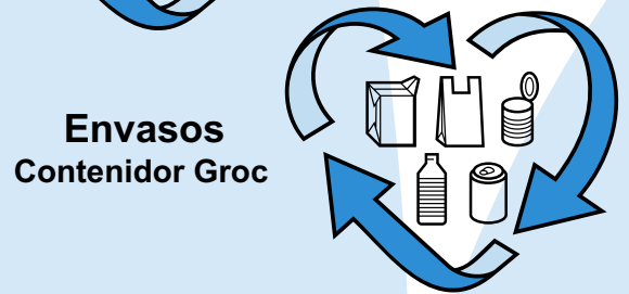
Envasos Contenidor Groc