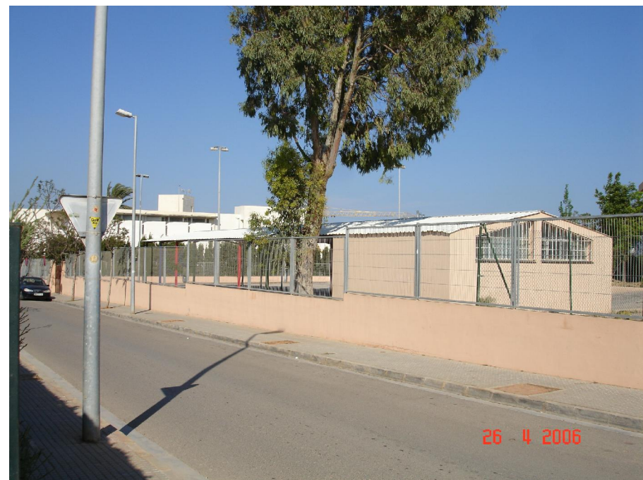
CARRER DE COSME VIDAL I LLÀCER