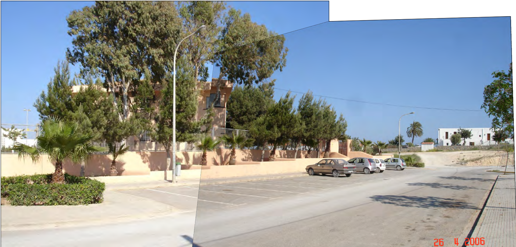
ZONA APARCAMIENTO EXISTENTE

El present document és propietat de l'arquitecte CARLOS R. GÓMEZ. La seva utilització sense l'expressa autorització de l'arquitecte està expressament prohibida. Qualsevol ús no autoritzat podrà ser sancionat segons la legislació vigent.