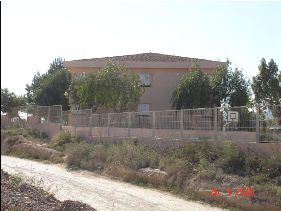
AVDA. DE SANT JORDI