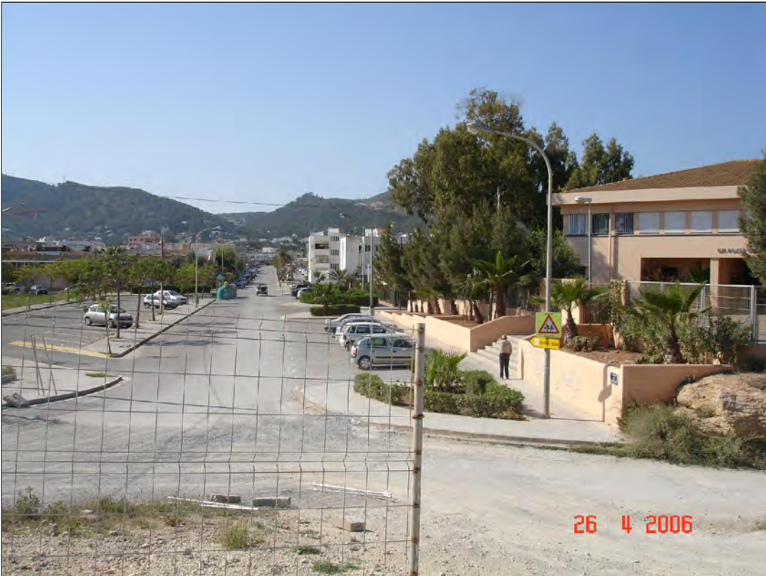
CARRER DE FELIP CURTOIS I VALLS