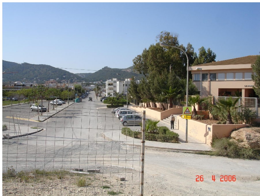
CARRER DE FELIP CURTOIS I VALLS