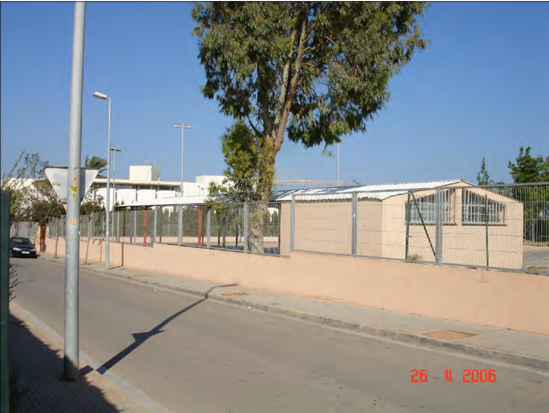
CARRER DE COSME VIDAL I LLÀCER