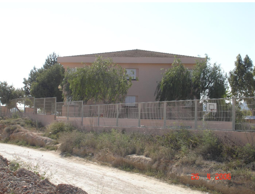
AVDA. DE SANT JORDI